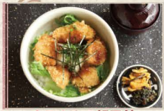
まごめやの親子丼 900円