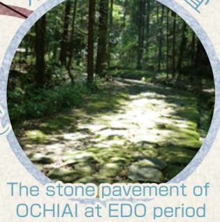
The stone pavement of OCHIAI at EDO period